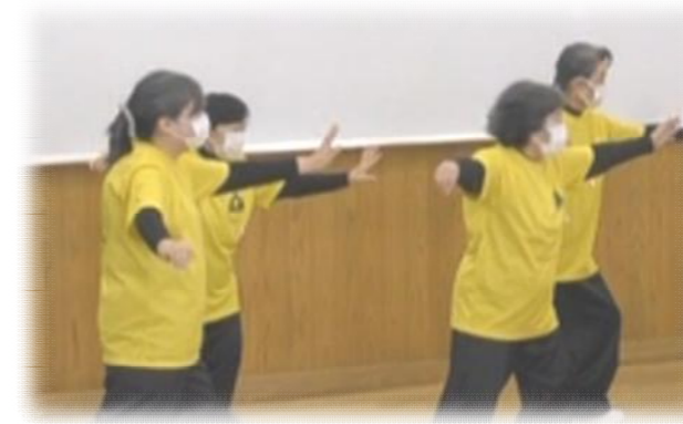
R6 年度久留馬ふれあいフェスティバルの様子