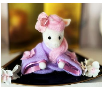
地区公民館で開催した羊毛フェルト講座の作品