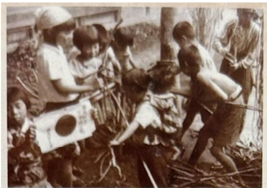
桑の枝の皮むき (服の材料)

地域で保管されてきた日記や配給券などの実物資料から、特攻隊や前橋空襲、当時の暮らしなど教科書に載らない生々しい歴史を伝えます。語り部による学童疎開の講演も実施。今だからこそ触れたい、郷土の記憶に触れる展覧会です。