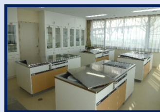
<1階調理実習室 (42.92㎡)> IHクッキングヒーターの調理台！