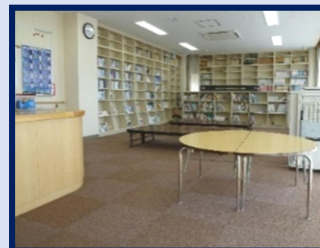
<1階図書室 (57.70㎡)> 床暖房完備で冬はとて暖かく、幅広いジャンルに渡りたくさんの本が揃っています。