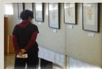
【水彩スケッチクラブ】