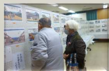
【歴史と文化を学ぶ会】