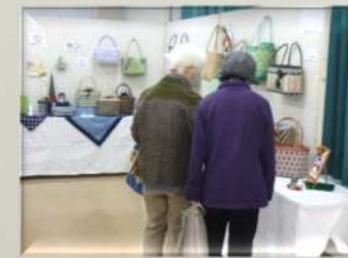
【エコクラフトクラブ】