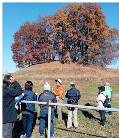
大鶴巻古墳について説明を 受ける参加者達

倉賀野宿の会では、これからも講演会や見学会などを 通して、魅力溢れるこの倉賀野の古墳や倉賀野宿といっ た歴史資産を紹介していきますので、是非一緒に活動 してみませんか。ご興味がある方は、倉賀野公民館 (TEL346-2214)までお問い合わせください。