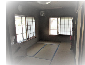
研修室(和室小7.5畳 打ち合わせ・事務作業等)