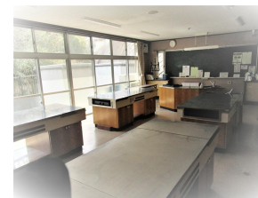
実習室(料理実習・フラ ワーアレンジメント等)