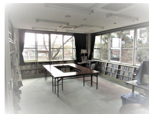
図書室(図書貸出・ 手芸・会議等)