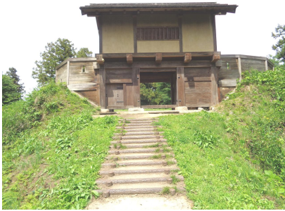
復元された箕輪城の門

武田信玄の跡取り勝頼ですが、初陣であったこの箕輪城攻防戦で討ち死にしているたかもしれないのです。「関八州古戦録」の中にこんな記述があります。『長野業盛の