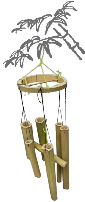
見本は公民館にあります。