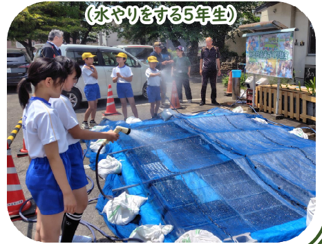
(水やりをする5年生)