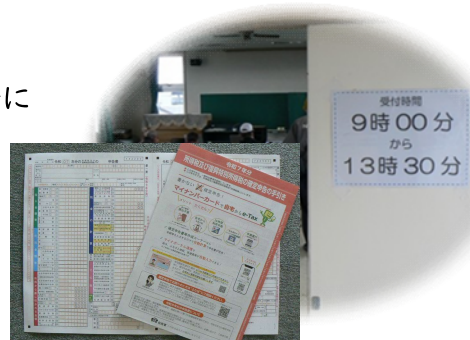
申告用紙のご用意は、お早めに

【訂 正】中川公民館だより1月1日号において、日時の午前8時30分～とあるのは誤りでした。お詫びして訂正します。