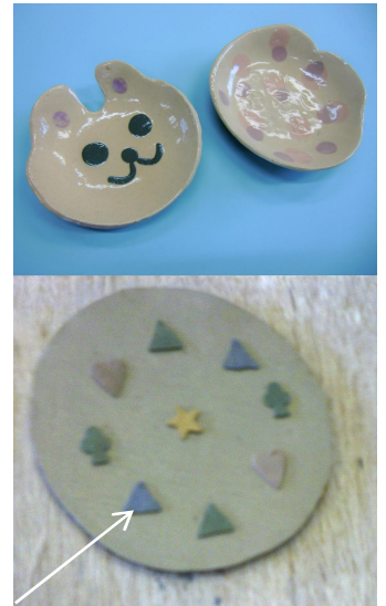
色々な形の型でぬき取った 色付き粘土の一つ