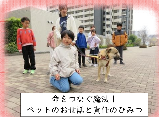
命をつなぐ魔法！ ペットのお世話と責任のひみつ