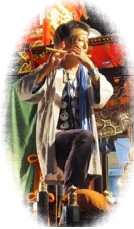
去年の高崎祭りにて