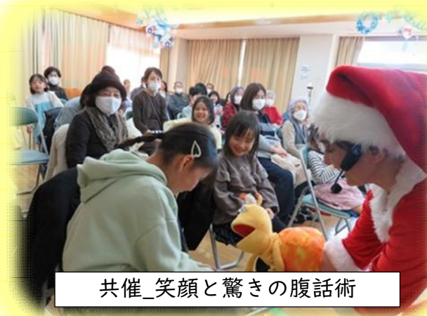
共催_笑顔と驚きの腹話術