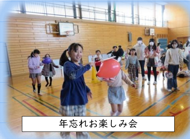
年忘れお楽しみ会