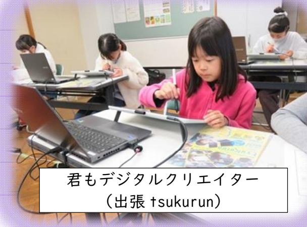
君もデジタルクリエイター (出張 tsukurun)