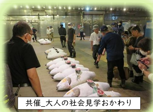
共催_大人の社会見学おかわり