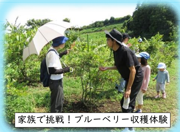
家族で挑戦！ブルーベリー収穫体験