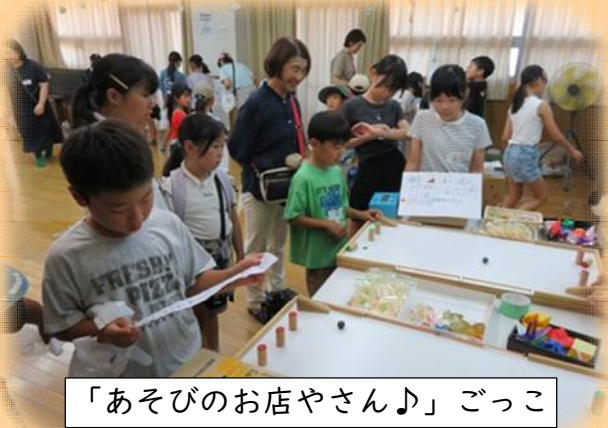
「あそびのお店やさん♪」ごっこ