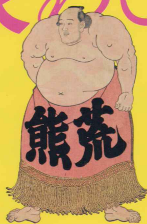
三代歌川豊国 《荒熊力之助》(部分)